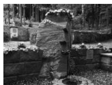
Unsere „Quelle des Naturheilbundes“ wurde im Juni 2015 unter Beteiligung einer großen DNB-Reisegruppe eingeweiht.

Tausende Besucher kuren und wandern jährlich in den gepflegten Anlagen und nutzen den modernen Balneopark (Natur-Wassergarten). Die Wasser-, Licht- und