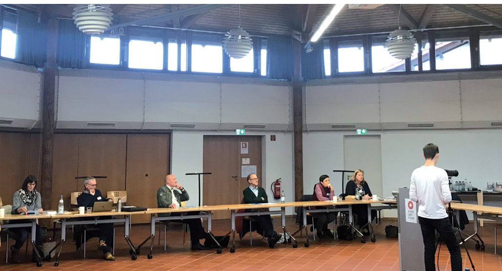
Arbeitskreistreffen 2020 unter Einhaltung der Hygiene- und Abstandsregelungen im Forum Hohenwart.

Wir starten das Jahr 2021 „Natürlich – Immun – Stark“!